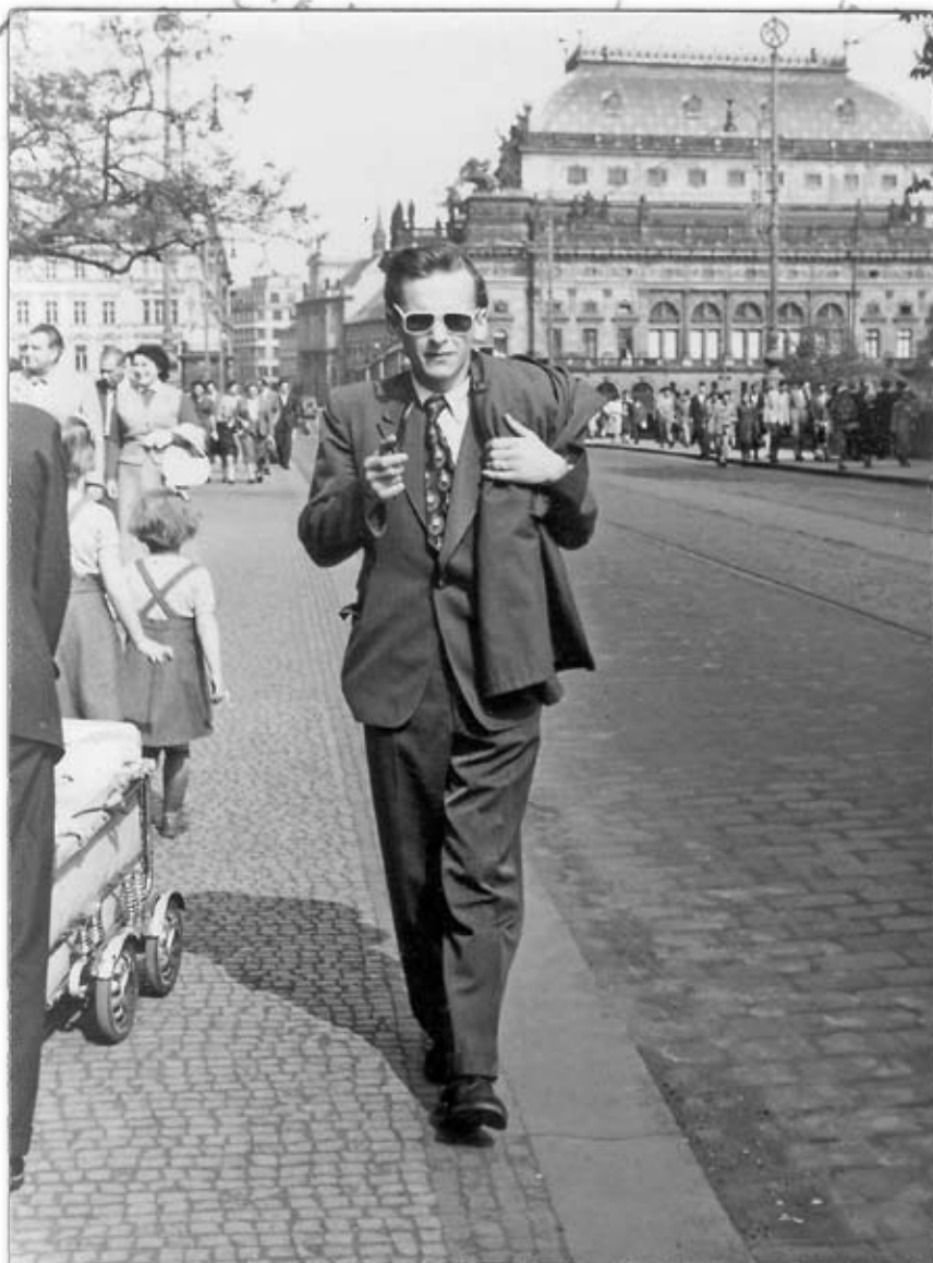
■ Krátce po příchodu do Prahy

„Někdy si zbývá jako dobytče / nazítrí po popravě jsme nesli otcí prádlo / večer mi kamarád dal vyřezanou loď / chodili jsme s ní na rezavou vodu / v krátech po pumách / a když tam vyschlo / tatínkova smrt / ztrácela na váze a chřadla / až byla z pampelišky / až byla šedivý z vojáků dešť / z popravčí čtyři dešť,“ napsal Pištora v jedné své básni inspirované ranou tragédií jeho života. Narodil se v Pardubicích a k to-